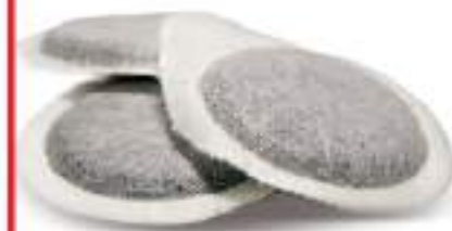
cialde in carta