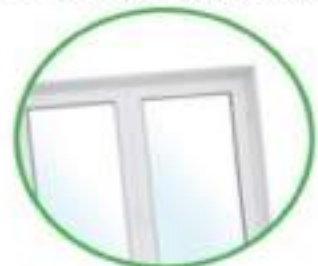
Vetri di finestre, finestrini di auto, vetri di fari e fanali