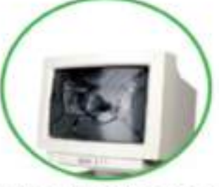
Tubi del televisore e schermi di tv, computer, monitor