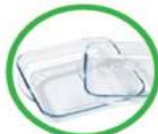
Contenitori in vetroceramica (pyrex, etc.)