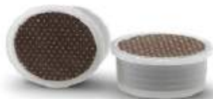
capsule di plastica svuotate