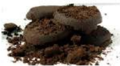
fondi di caffè