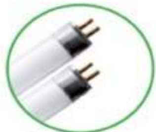
Tubi al neon