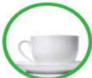
Oggetti in ceramica e porcellana