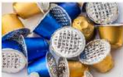
capsule di alluminio svuotate