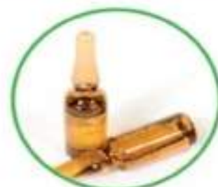
Confezioni in vetro dei farmaci usati