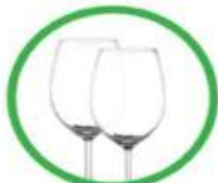
Oggetti in cristallo (bicchieri, lampadari, centrotavola, etc.)

C'è vetro e vetro. Perché alcuni oggetti, che istintivamente butteremmo nell'apposito contenitore per la raccolta del vetro, hanno in realtà un'altra destinazione. Eccoli: