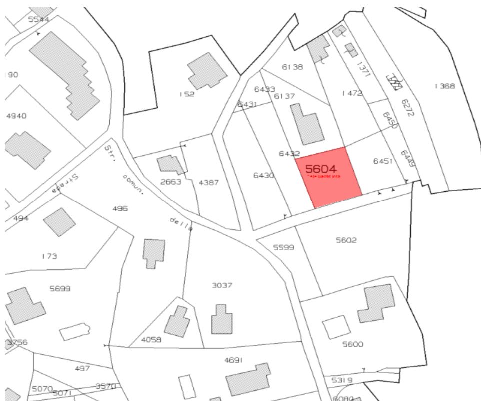
Mappale n. 5604